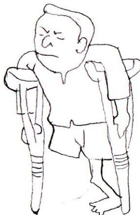
จบอุปฆาตกรรม

สรุป อุปฆาตกรรม เป็น หน้าทีของกรรม บุคคลทั้งหลายรู้ไม่ได้ว่าเคยทำกรรมอะไรไว้ที่จะมีกำลัง ส่งผลมาเป็นอุปฆาตกรรม จะรู้ถึงเหตุแห่งกรรมว่าดีหรือชั่วก็ต่อ เมื่อกรรม นั้นมาสนองแล้ว ฉะนั้นเมื่อกำลัง ได้รับผลของกรรมฝ่ายกุศลหรือฝ่ายอกุศลก็ตามขอให้รู้เท่าทัน จะได้ไม่หลงติดสุขที่กำลังได้รับ และไม่ทุกข์ใจ มากนักเมื่อกำลังได้รับทุกข์ แต่ในปัจจุบันนี้ต้องเพียรละชั่วกระทำแต่ความดี ไม่ประมาทในอกุศลกรรมแม้เพียง เล็กน้อย เพราะกรรมที่คิดว่าเพียงเล็กน้อย ทำไปเพราะคึกคะนองบ้าง ทำไปเพราะทำตามๆ เขาบ้าง เหล่านี้ อาจมีกำลังส่งผลมาทำหน้าที่อุปฆาตกรรมได้