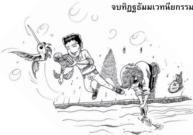
จบทิฏฐธัมมเวทนียกรรม

ฉะนั้น การบริจาคทานจึงต้อง ทำความเข้าใจว่าเราควรมีเจตนาตั้งใจในการทำทาน แต่ปฏิบัติคือ ผู้รับทานนั้นอย่าได้ปรารถนาเลย ขอให้ น้อมระลึกบูชาพระรัตนตรัย บูชาคุณพระพุทธเจ้า บูชาคุณพระธรรม บูชาคุณพระอริยสงฆ์ น้อมระลึกอย่างนี้แล้วจึงให้ทาน ผลแห่งทานนั้นย่อมมีผลอย่างมาก หรืออย่างสูงได้